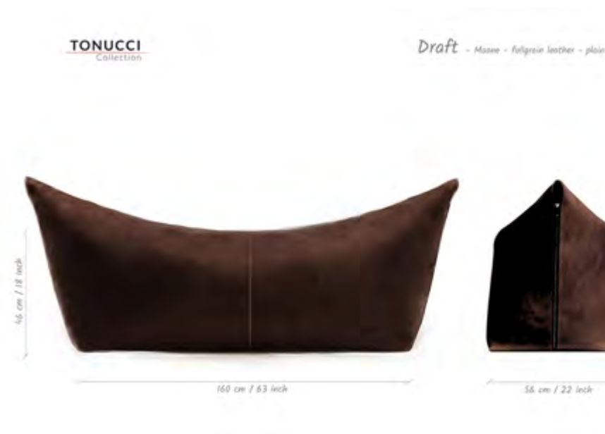
Maone design Viola Tonucci

Il cuoio utilizzato viene ripiegato su nuovo disegno ispirandosi alla tecnica dell'origami: da questo gesto si crea e rimane nella memoria del materiale la forma del pouf. Realizzato in cuoio pieno fiore o cuoio smerigliato per uso contract. Mao ha ricevuto una menzione d'onore nel 2011 al concorso Young&Design, Milano. Dimensioni: 72 x 42 x h42 cm