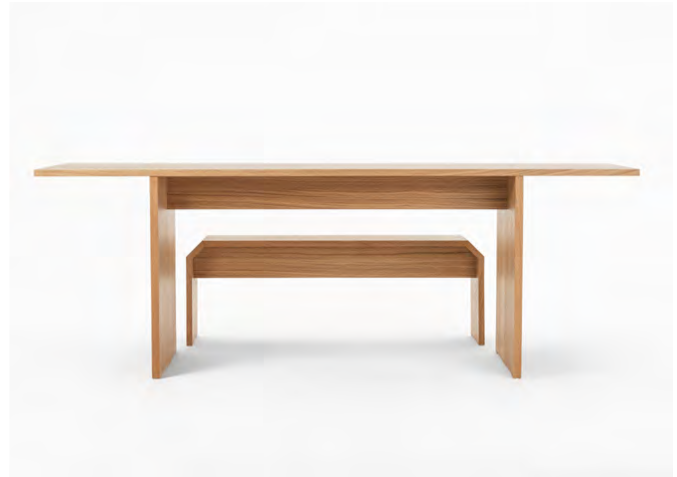
Piano - consolle e panca design Enrico Tonucci

London 21 - 23 May 2024 Clerkenwell design week DESIGN FIELDS Booth DFB1