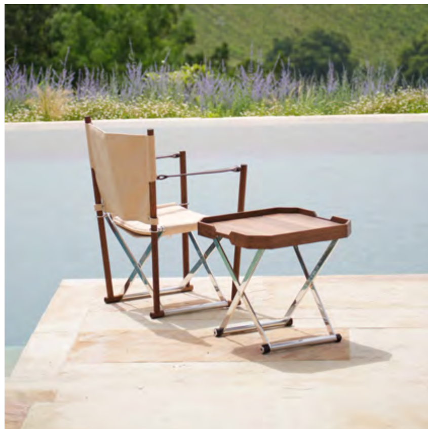
Regista Lounge design Enrico Tonucci

London 21 - 23 May 2024 Clerkenwell design week DESIGN FIELDS Booth DFB1